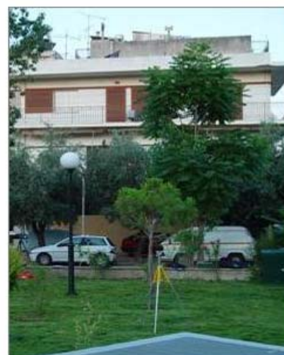
Εικόμα Α2-13. Στάθμη ταχύτητας δόνησης στον τοίχο της σήραγγας ΤΒΜ στο C/O 27 στη Χ.Θ 14.583 στο Νομισματοκοπείο στην επέκταση Σταυρού. Κατηγορία Εδάφους 2Α+3Β